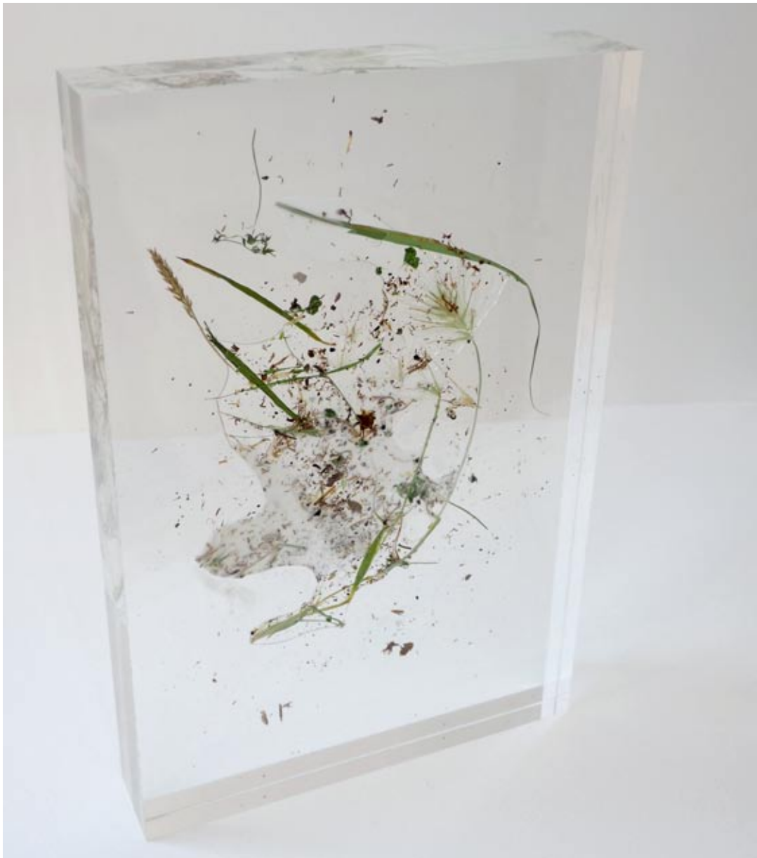
MH05203 , 2020

Metacrilato, resina epoxi, pigmento blanco, malas hierbas. 20x30x4 cm.